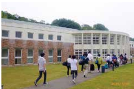
東京、山口、福岡のアスリートたちからなる女子バスケットチーム

来月末に開会の迫ったロサンゼルス世界大会に向けて、日本女子バスケットボールチームの合宿が行われました。ユニクロ社の陸上部が使われている宿泊・食堂施設や、日ごろSON・山口バスケットボールプログラムで利用させて頂いている体育館を全面開放して頂き、社員の方に練習にもボランティアとして加わって頂くなど、同社のみならず大変お世話になりました。