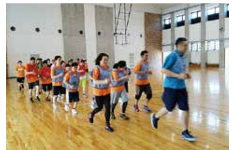
練習にはSON・山口のアスリートも参加しました