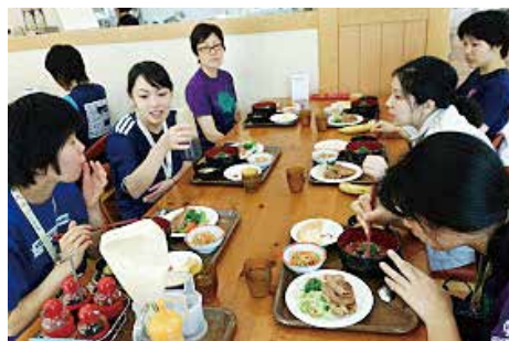
食堂での和やかな食事タイム